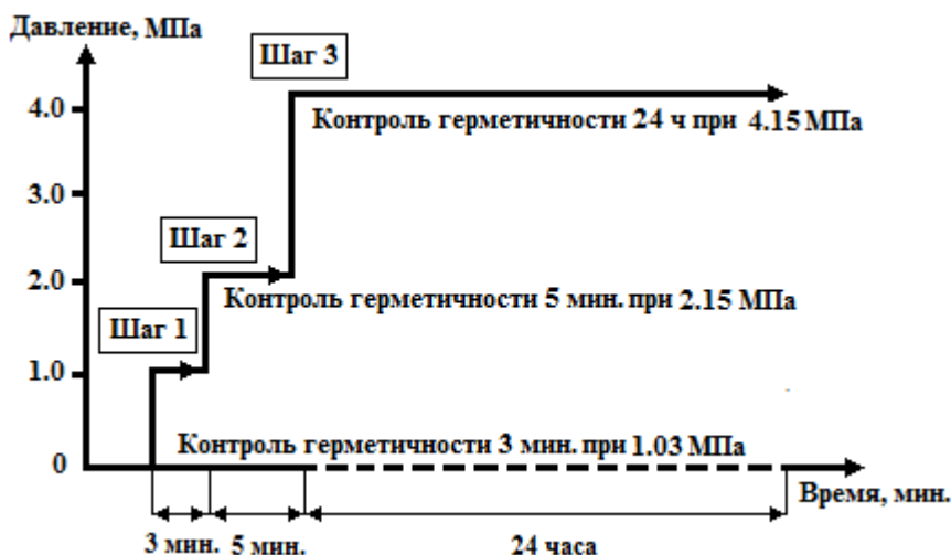
Рисунок 2 - Проверка герметичности азотом хладагента R 410A

5.5.6 Неплотности допустимо выявлять путем обмыливания медных труб, их разъемных соединений с испарительным блоком и компрессорно-конденсаторным блоком, а также паяных неразъемных соединений медных труб мыльной пеной с добавкой глицерина и последующим наблюдением за появлением пузырьков в местах неплотностей.